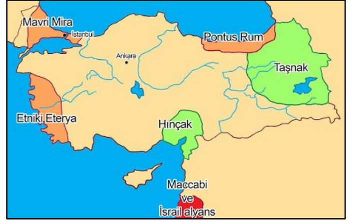
Harita-2: Azınlıkların kurduğu Cemiyetlerin faaliyet gösterdikleri alanlar

1- Mondros Ateşkes Antlaşması'ndan sonra Osmanlı Devleti'nin toprakları İtilaf Devletleri tarafından yer yer işgal edilirken, Osmanlı Devleti'nin sınırları içerisinde yaşayan gayrimüslim azınlıklar bazı bölgelerde bağımsız devlet kurmak için çeşitli örgütler adı altında zararlı faaliyetlerini sürdürmüşlerdir. İstanbul Hükümeti'nin tepkisiz ve teslimiyetçi tutumuna karşı Türk halkı bulundukları yörelerde Kuvay-ı Milliye birliklerini kurarak hem İstanbul Hükümeti'nin teslimiyetçi politikasını protesto etmiş hem de bulundukları bölgenin hak ve hukukunu her türlü haksızlığa ve işgale karşı savunmaya çalışmıştır.