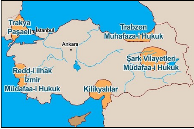
Harita-1: Milli (Yararlı) Cemiyetlerin faaliyet gösterdikleri alanlar