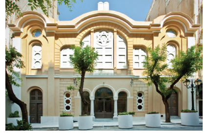
Yad Lezikaron Sinagogu

Verilen görsellerden Selanik ile ilgili aşağıdakilerden hangisine ulaşılabılır?