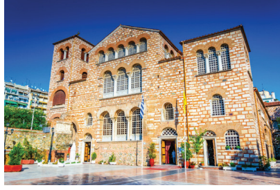
Aziz Dimitrious Kilisesi