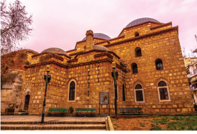
Alaca İmaret Camisi

33. Aşağıda Selanik'te yaşamış milletlere ait yapıların görsellerine yer verilmiştir.